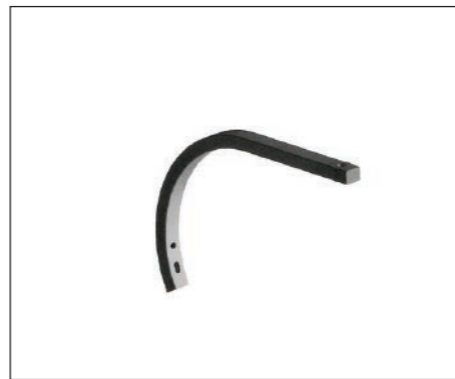
Brazo 40x30 de acero de alta resistencia