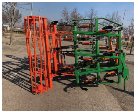
Posibilidad de estacionamiento plegado con dos apoyos delanteros