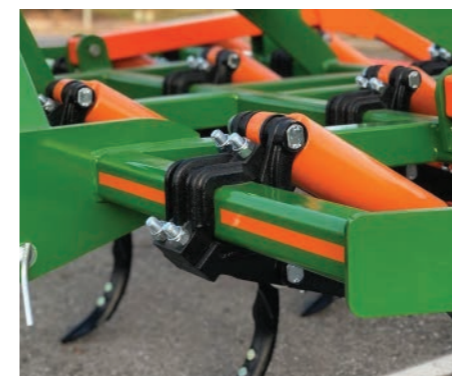
Brazos atornillados en el chasis