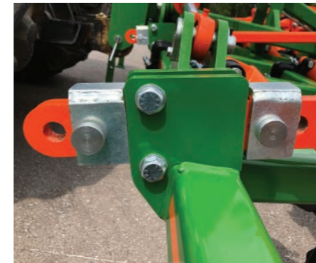
Sistema ControlRoll con fácil ajuste por la parte delantera y reparto de esfuerzos a todo el chasis