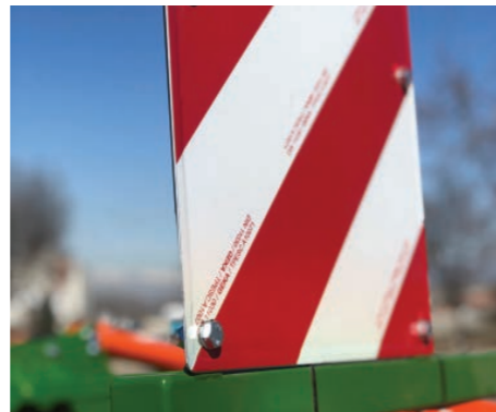
Opción de kit de placas y luces