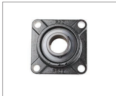
Rodamientos de alta calidad INA-FAG