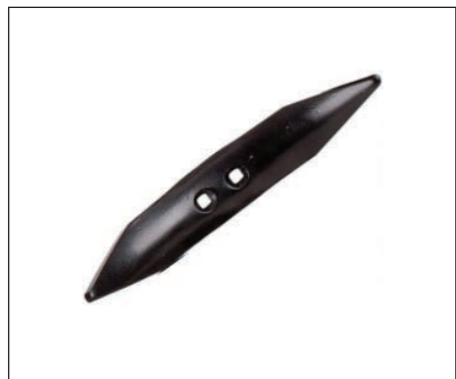
Múltiples posibilidades de rejas de diferentes anchuras y formas