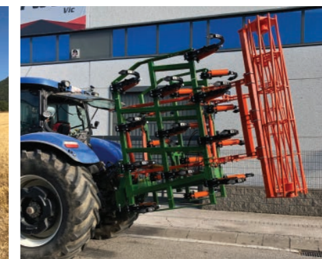
Plegado hidráulico vertical en dos partes