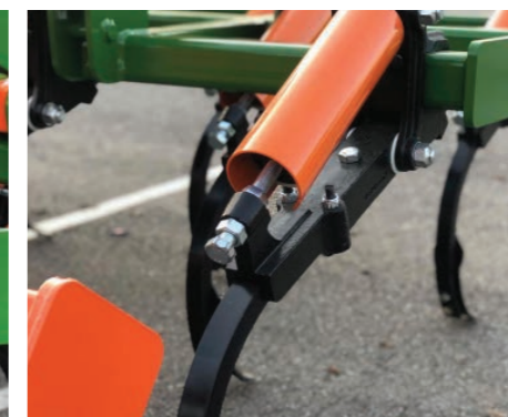
Brazo 40x30 reforzado