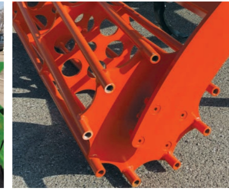
Rodillo tubular de gran diámetro