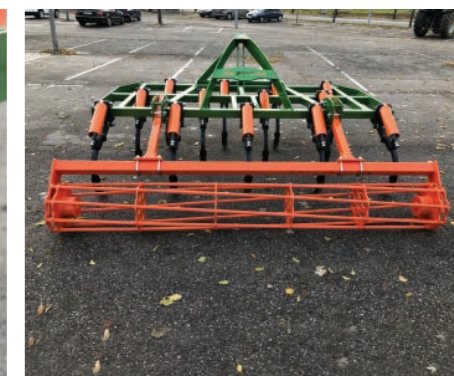
Rodillo de rea de 38 cm de diámetro