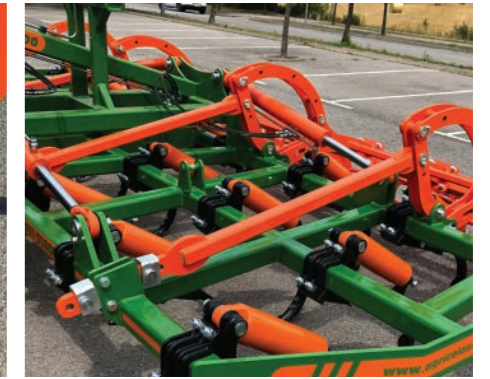
Doble cilindro de plegado por cada lado con válvula de seguridad