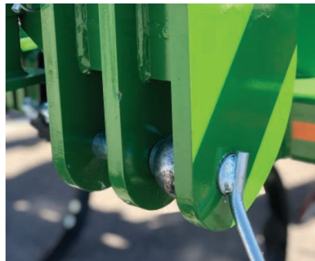
Doble enganche Cat. II i Cat. III en los brazos inferiores y al tercer punto