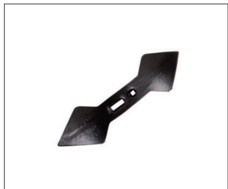
Múltiples posibilidades de rejas de diferentes anchuras y formas