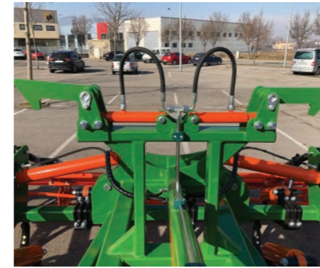
Sistema de seguridad con doble cilindro hidráulico