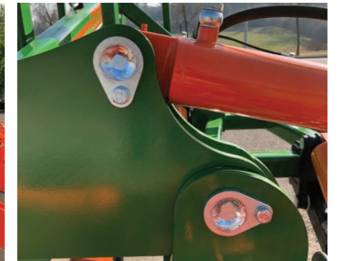
Pasadores fijados con tornillo para evitar rotación