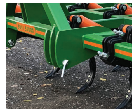
Doble enganche de Cat. II y Cat. III