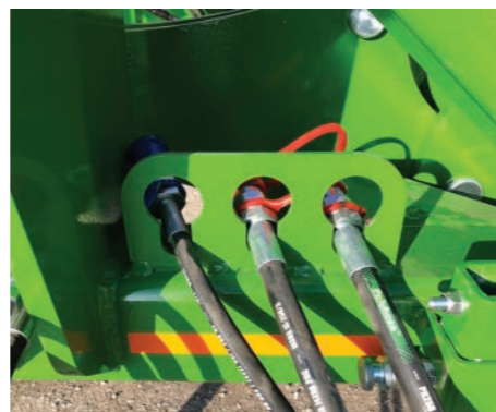
Soporte para colocar los tubos hidráulicos