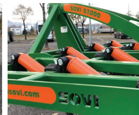
Diseño de calidad