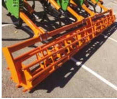
Rodillo tubular de gran diámetro