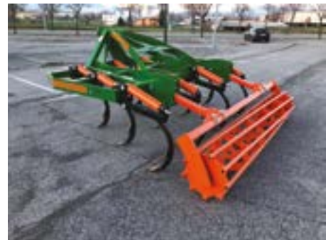
Rodillo tubular de gran diámetro