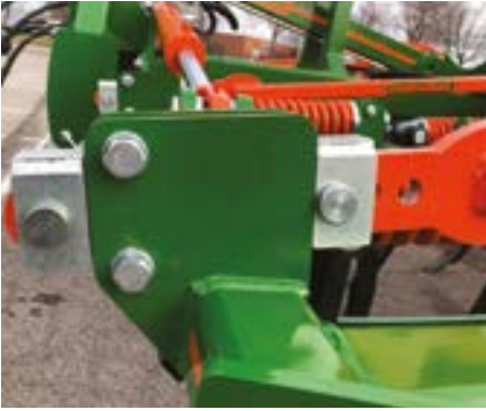
Fácil ajuste del rodillo por la parte delantera