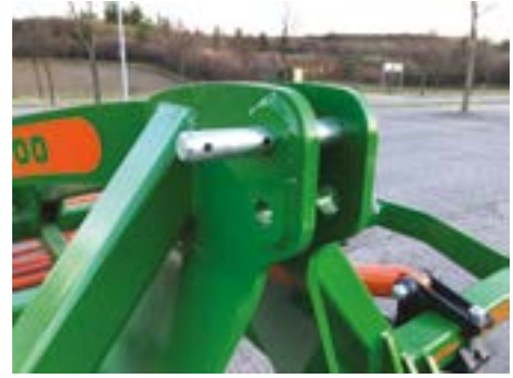
Enganches Cat. II y Cat. III