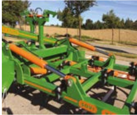
Doble cilindro por cada lado