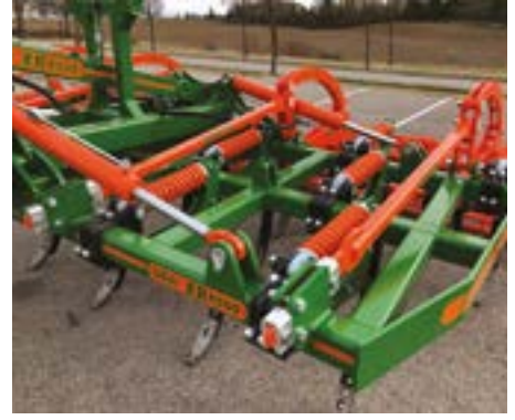
Sistema ControlRoll con reparto de esfuerzos a todo el chasis