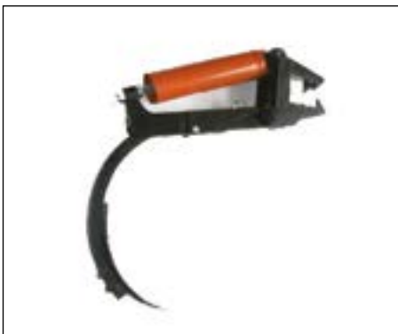
Brazo de 40x40 alto