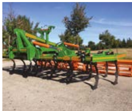
Plegado por el medio