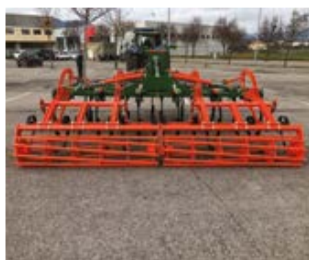
Plegado por el medio y estacionamiento plegado con dos apoyos delanteros