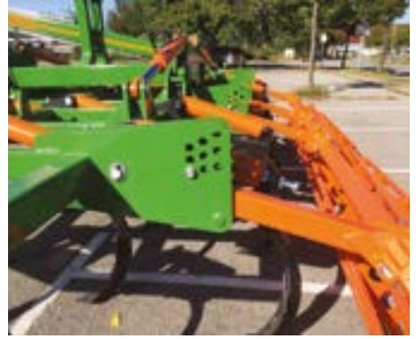
Ajuste de altura del rodillo con pasador