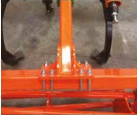
4 abarcones en cada brazo del rodillo