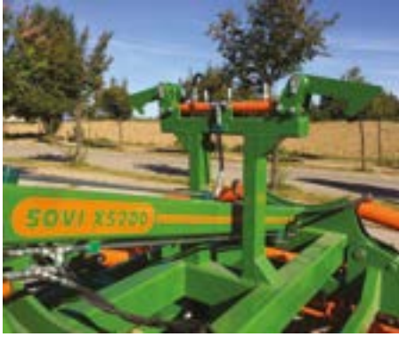
Sistema de seguridad con doble cilindro hidráulico