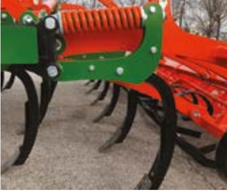
Conjunto de brazo con doble muelle SoviArm