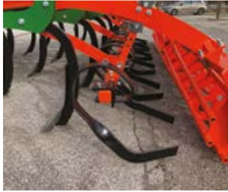
Fila de paletas posterior con ajuste de los extremos