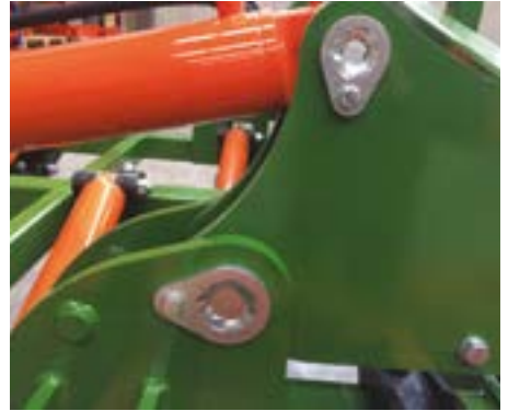
Pasadores fijados con tornillo para evitar desgaste